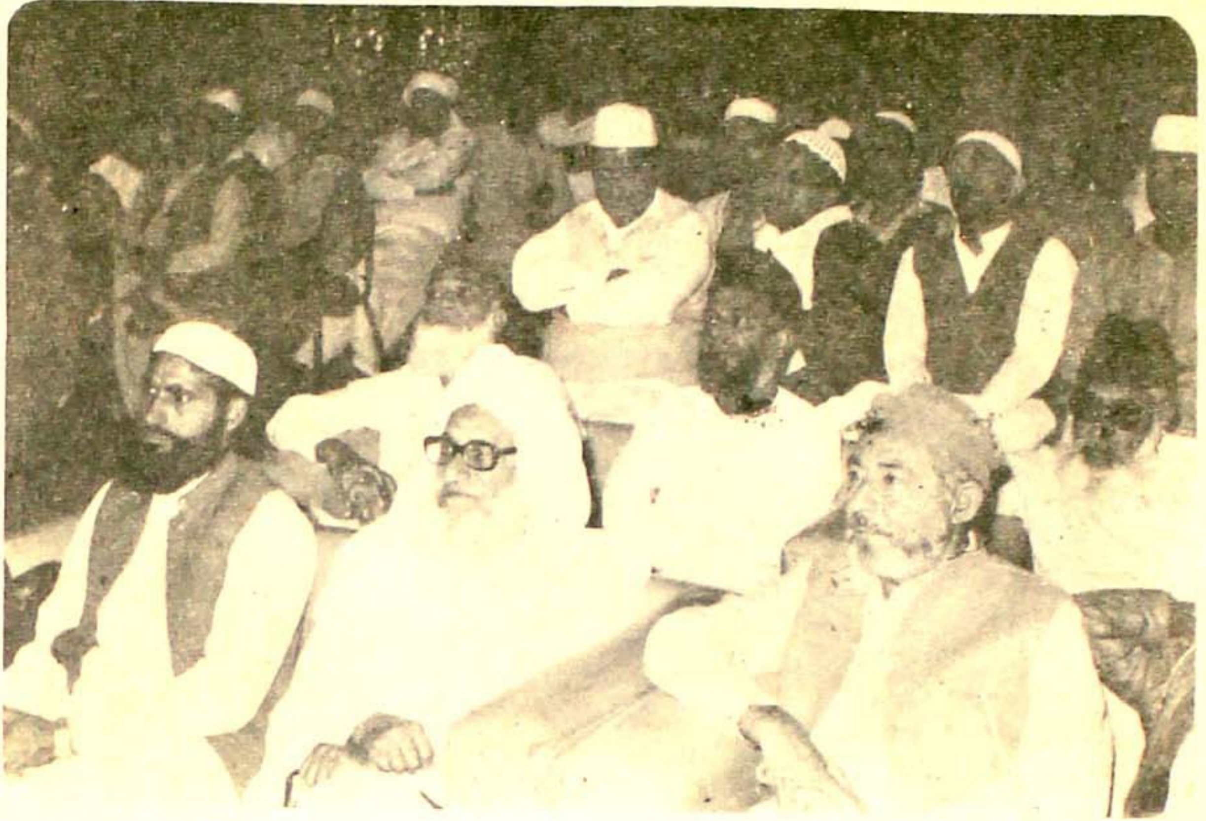
ثناء خوان کازہر عالم صلی اللہ علیہ وآلہ وسلم