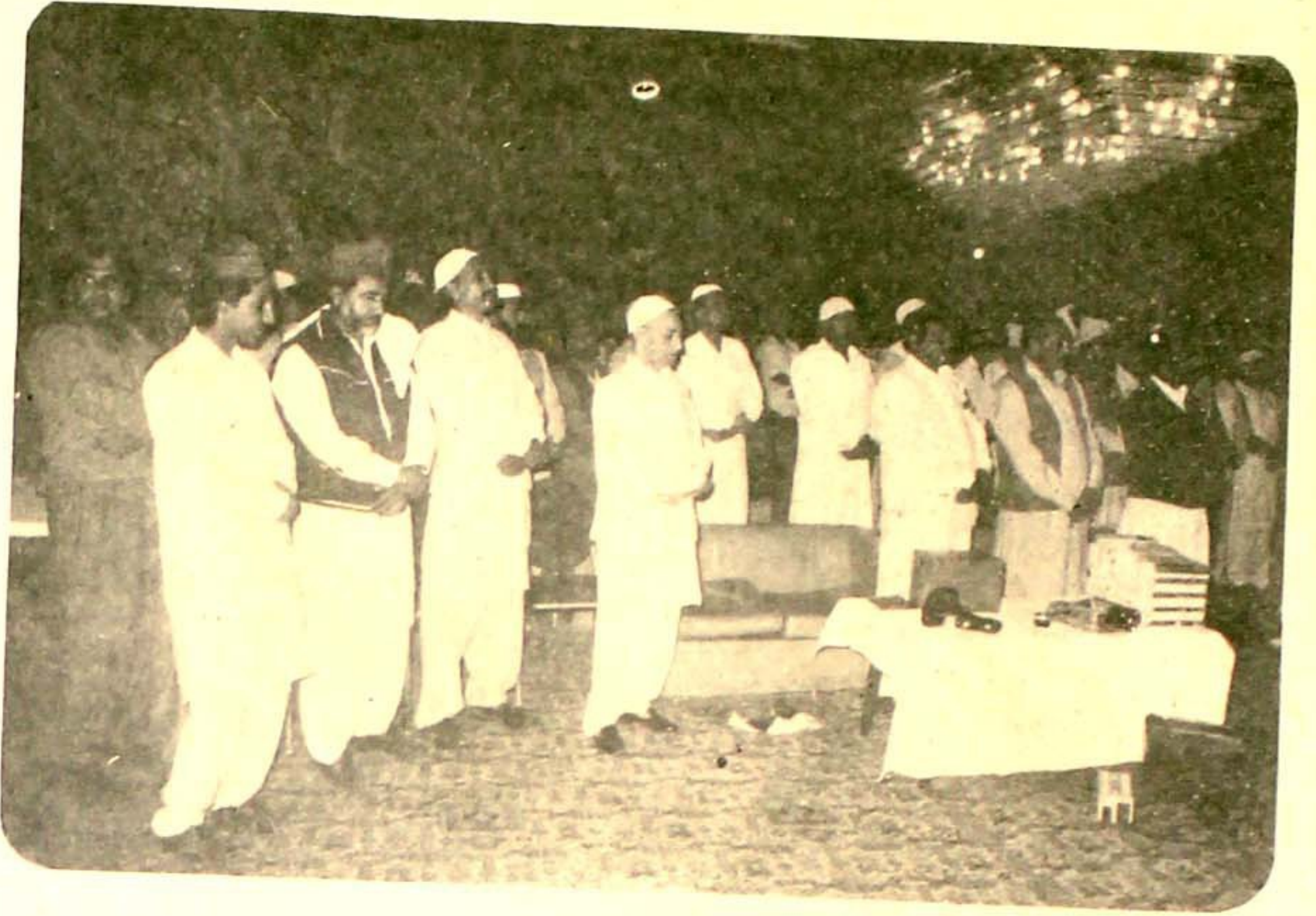
سلام بحضور نبی اکرم صلی اللہ علیہ وآلہ وسلم