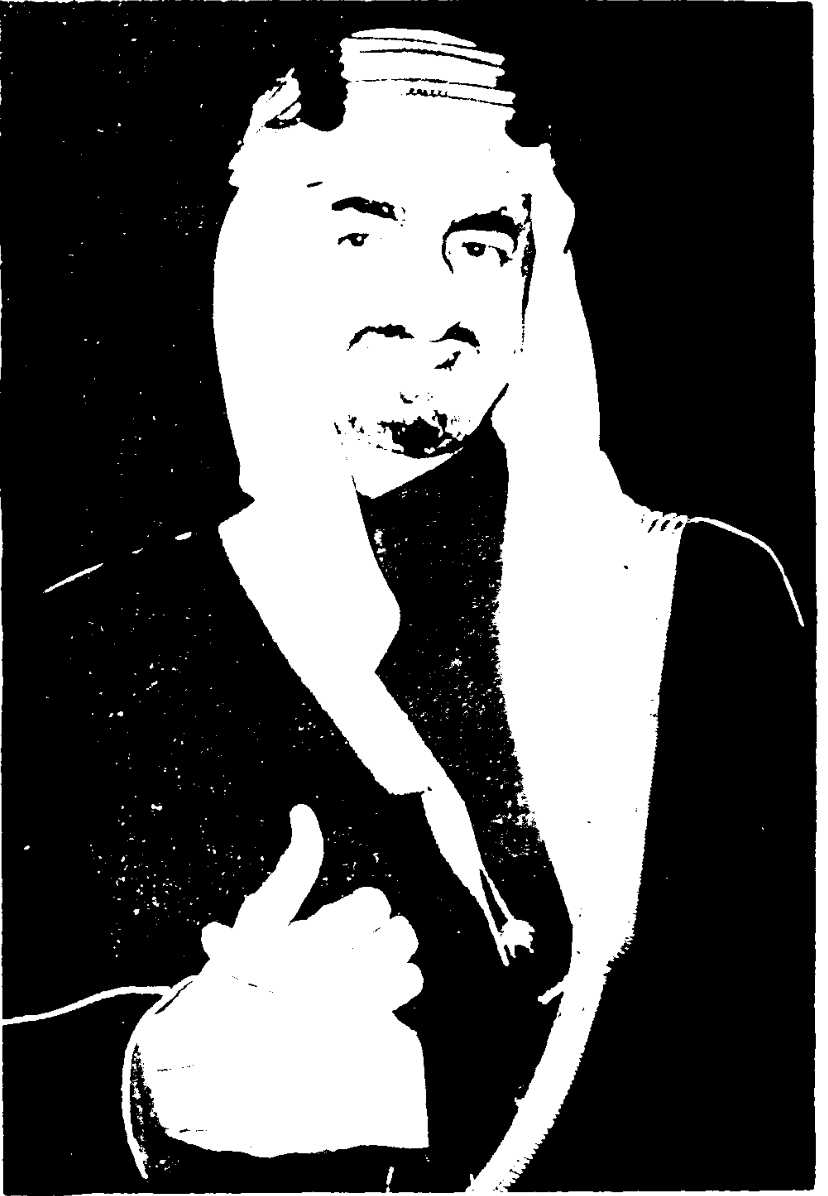
صاحب المجلدات والمذكرات فيصل بن عبد العزيز آل سعود