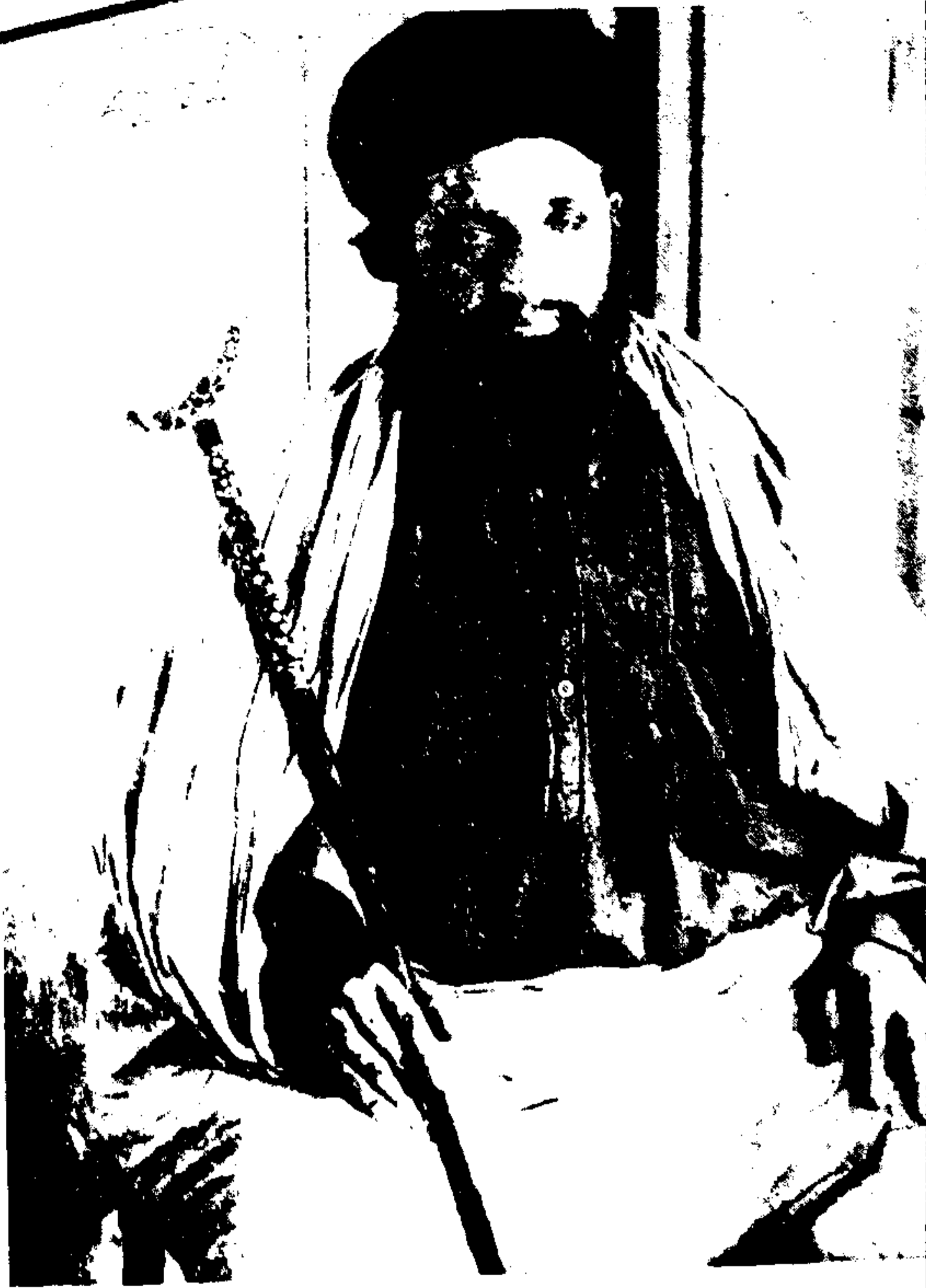
شہید حضرت نورالشاہ فیضی عمقرقدس سترۃ العزیز