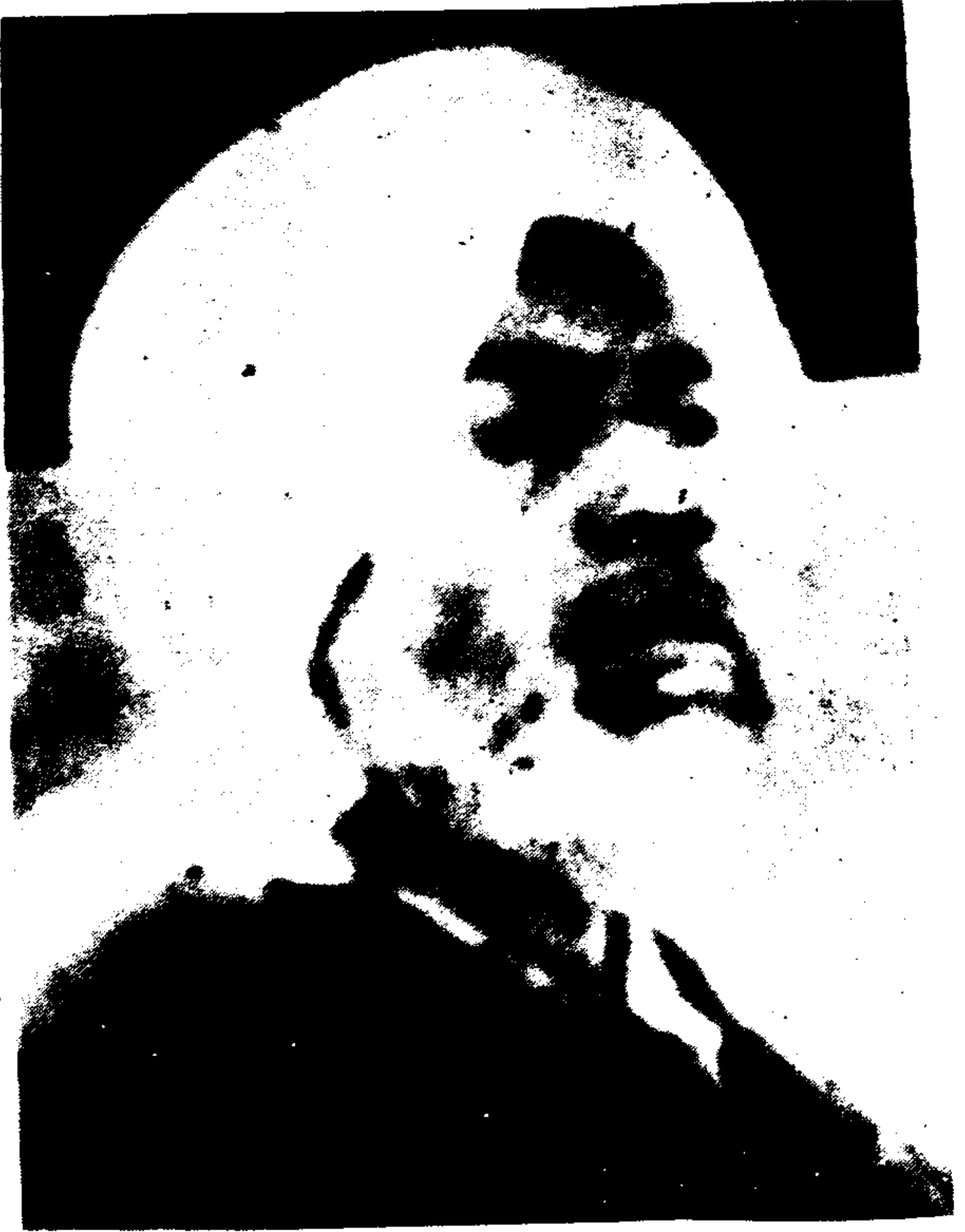
حضرت امام العالمين خواجه پير احمد زمان صديقي نقشبندي قدس سره، چھون مجادہ نشين درگاہ عالیہ ' اري شريف