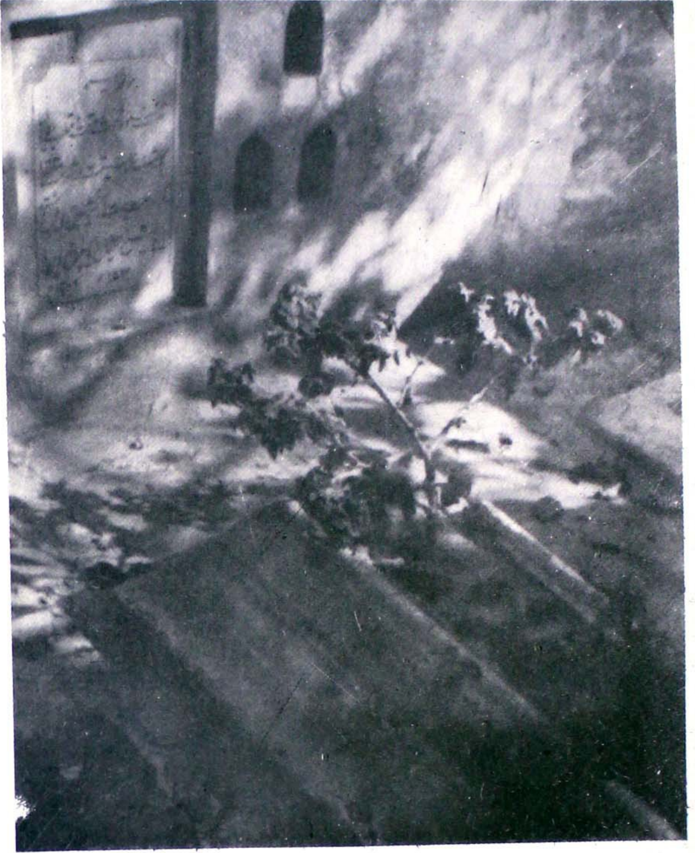
مزار مبارک حضرت فقیہ الہند مفتی محمد مسعود شاہ محدث دہلوی درگاہ حضرت خواجہ باقی باللہ دہلی