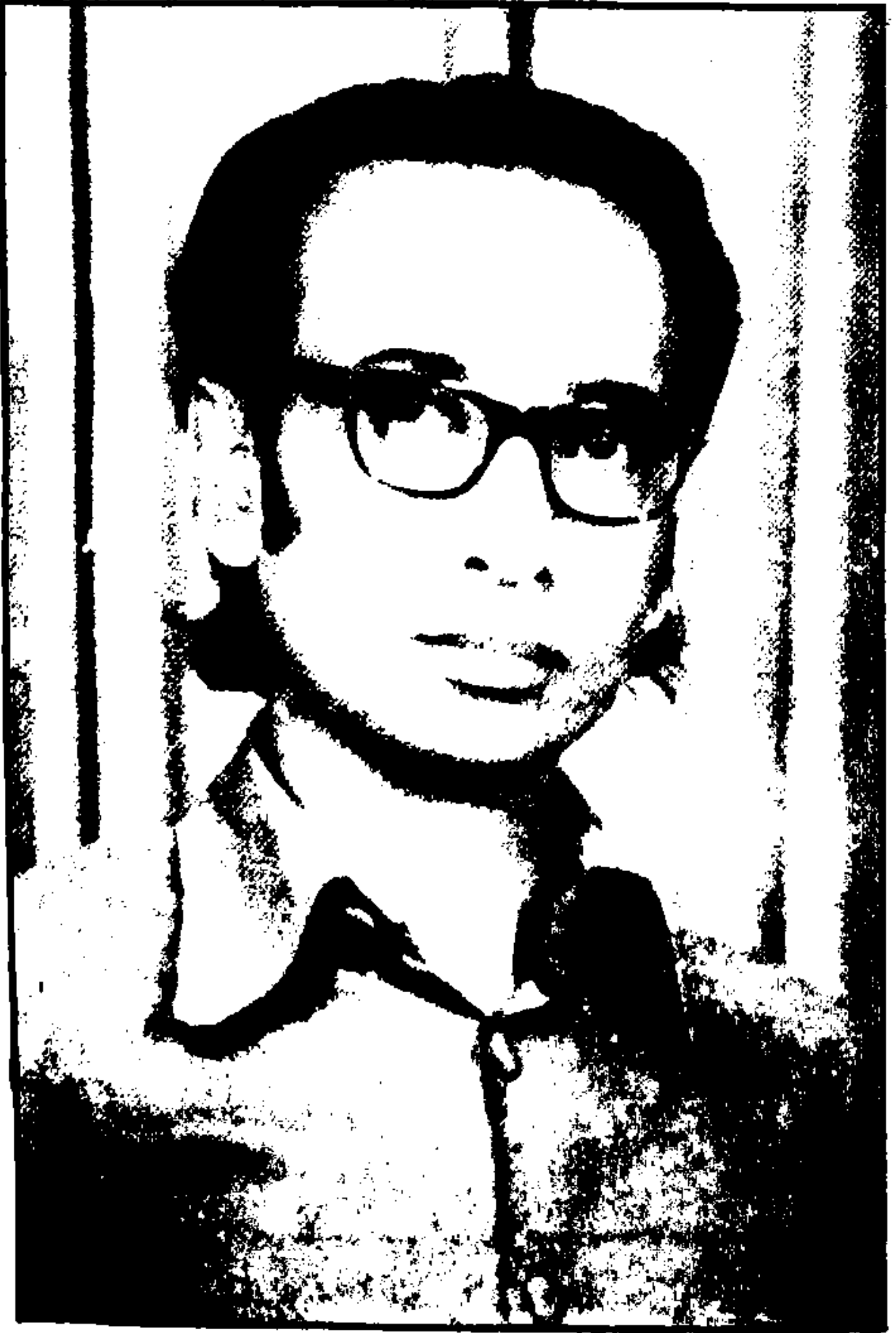
پروفیسر محمد فائق صدیقی قادری بدایونی

چمکے ہیں اندھیرے میں کبھیرے ہیں اجالے ہم بھی تو کبھی صورت مہتاب رہے ہیں