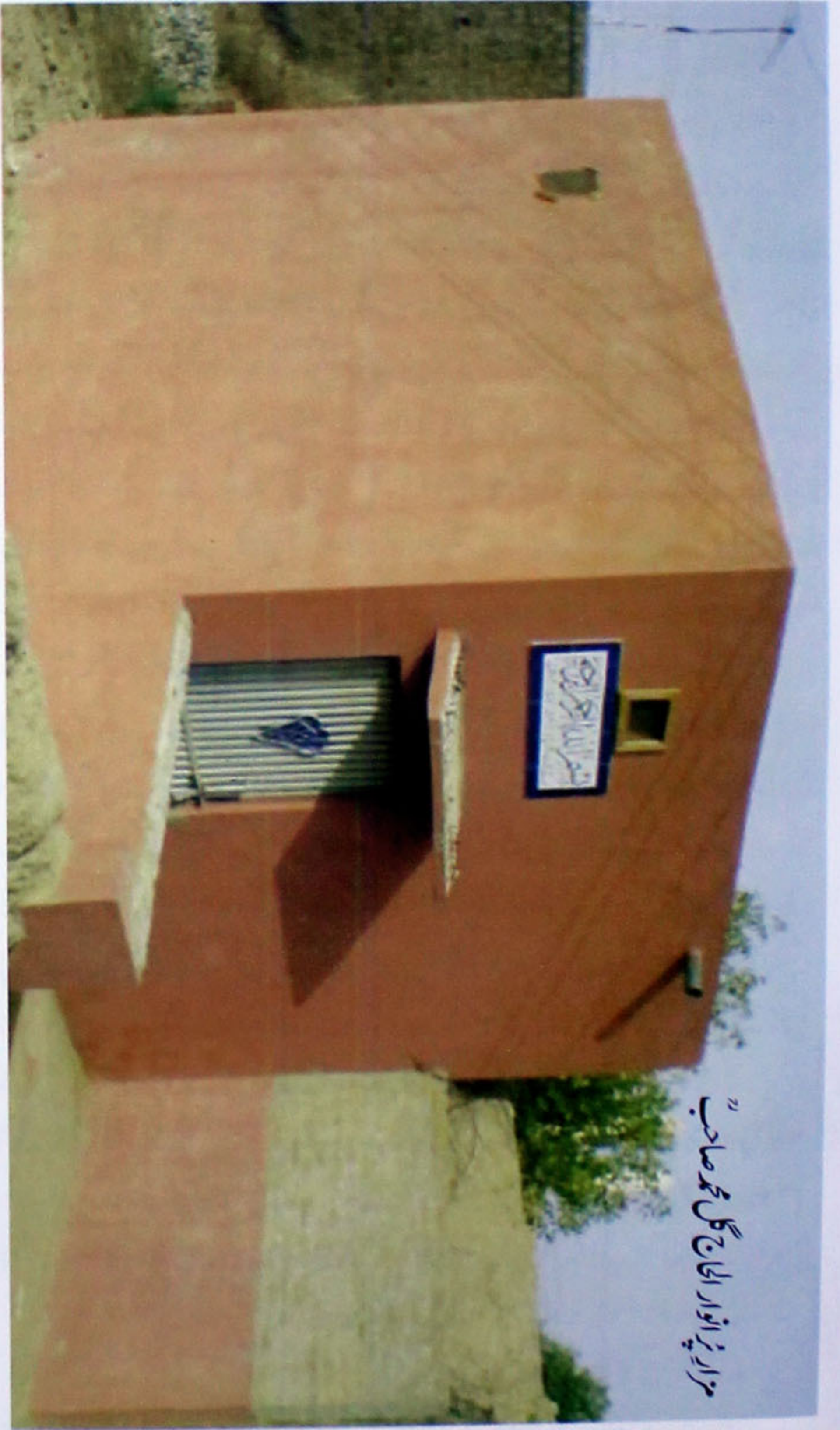
مزار پُر انوار الحاج گل محمد صاحبؒ