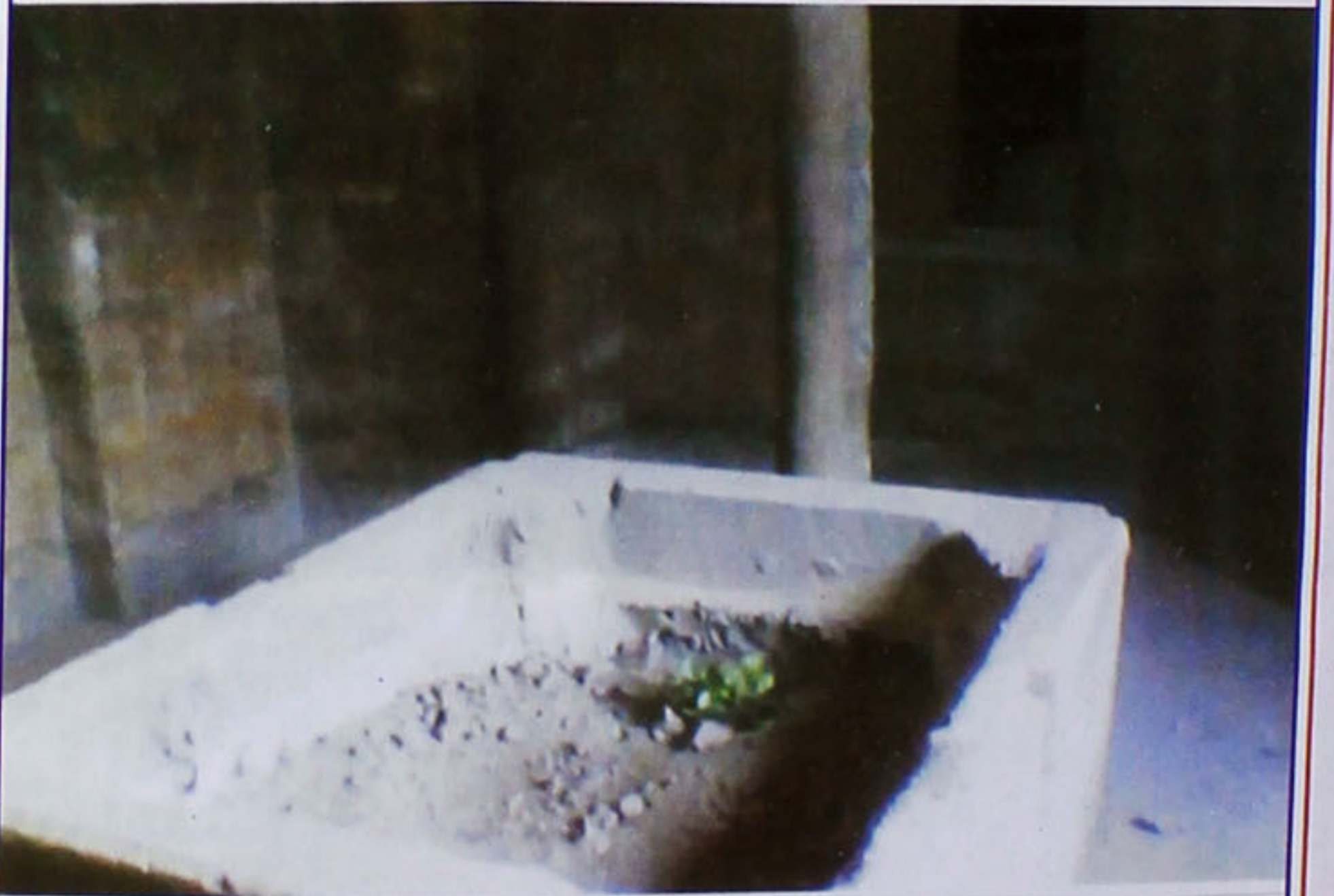
اندرون روضہ قبر اطہر کا ایک منظر