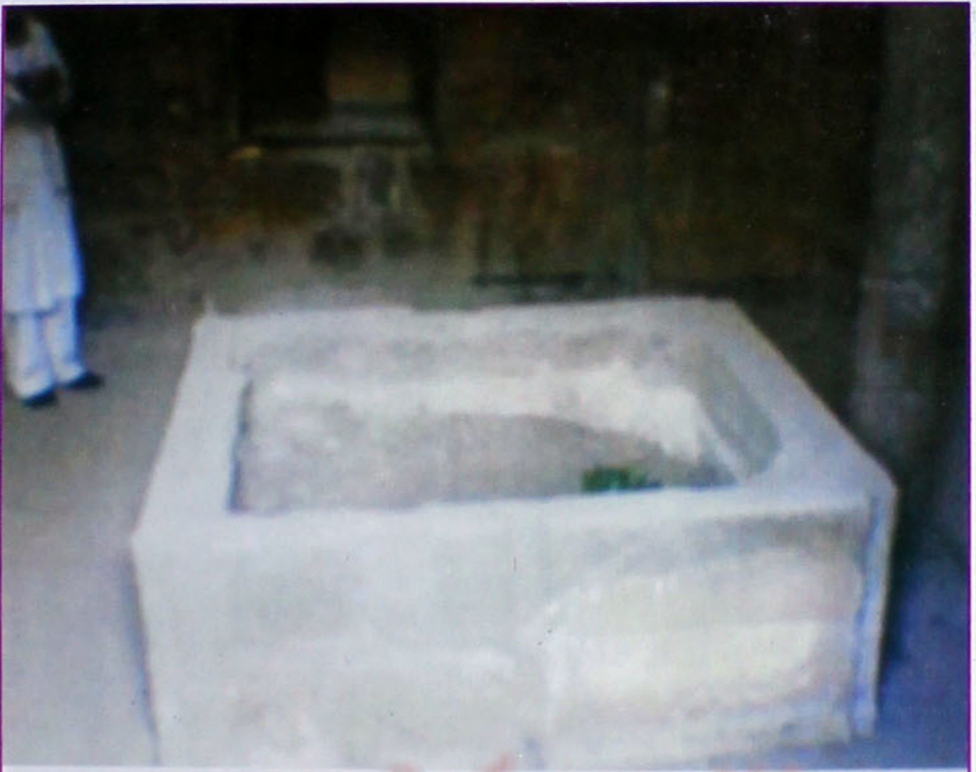
امام ابو جعفر طحاوی رضی اللہ تعالیٰ عنہ کی مرقد منوّر۔ قاہرہ مصر۔