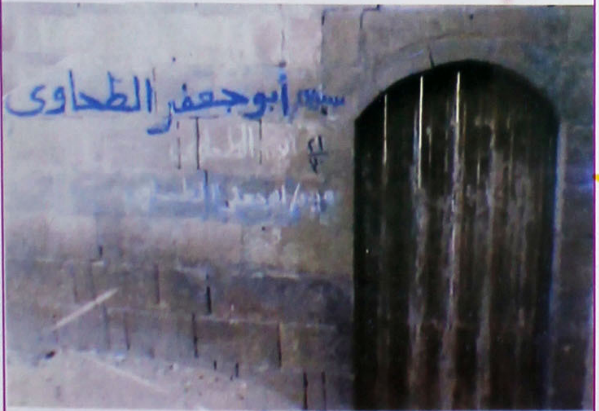
احاطہ مزار پر انوار کا ایک دروازہ