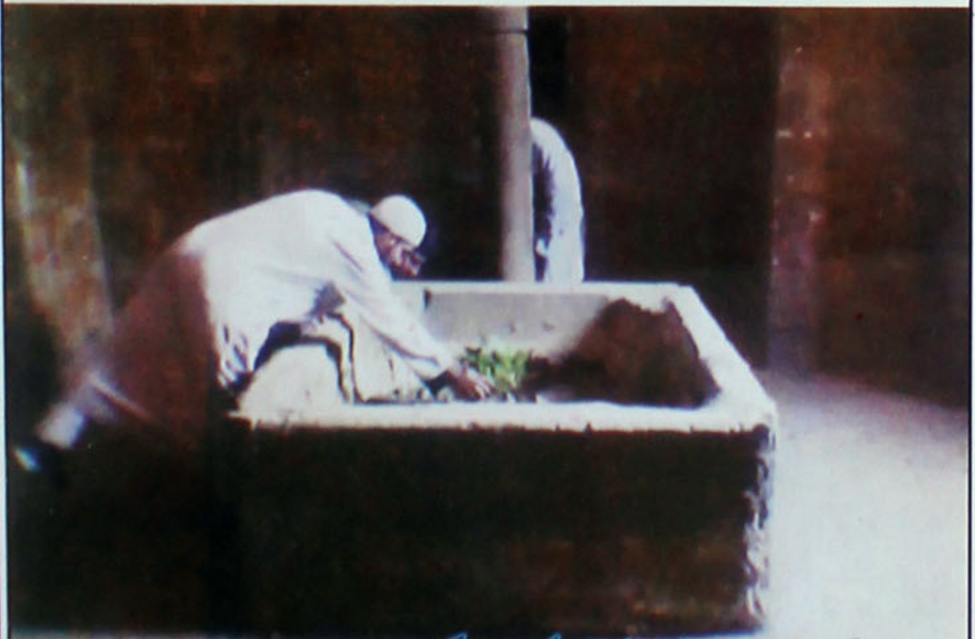
اندرون روضہ قبر انور کو مس کرتے ہوئے زائرین