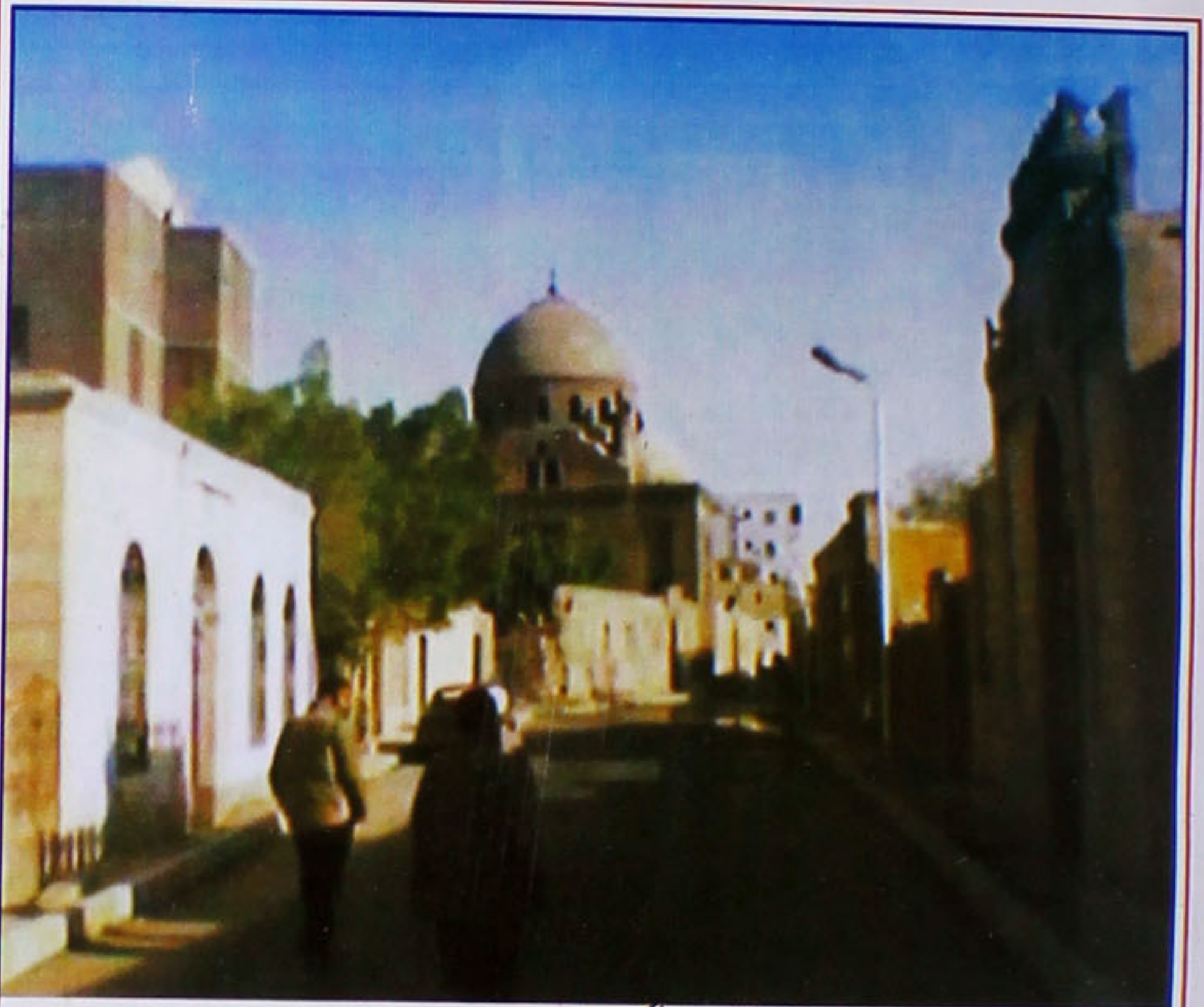
شارع عام سے گنبد کا ایک پروقار منظر