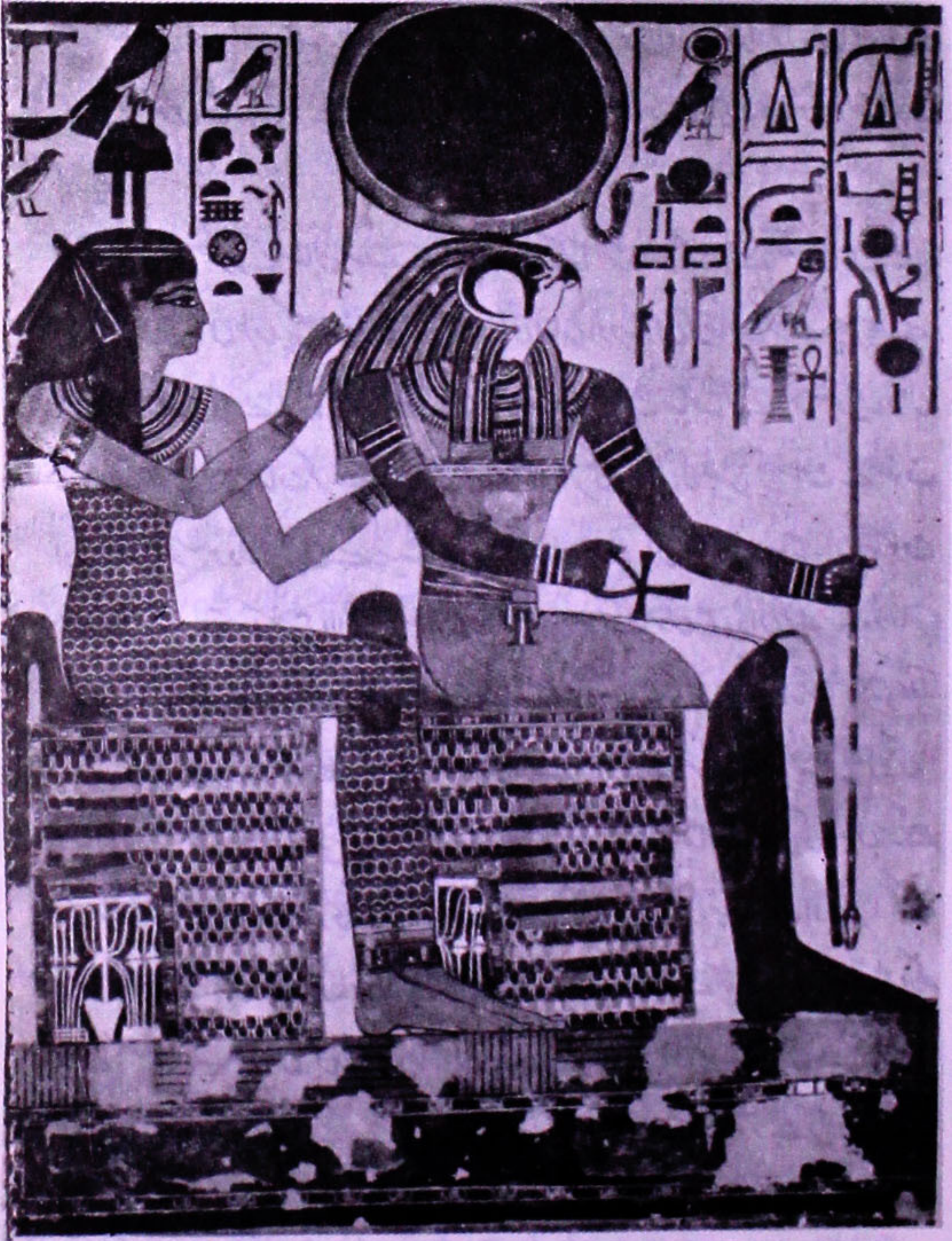
ملکہ نیفرتاری کے مقبرے کی ایک تصویر۔ دیوتارے، حُر خطی اور عمون، طیط و یوی بصد جاہ و جلال بیٹھے ہیں۔