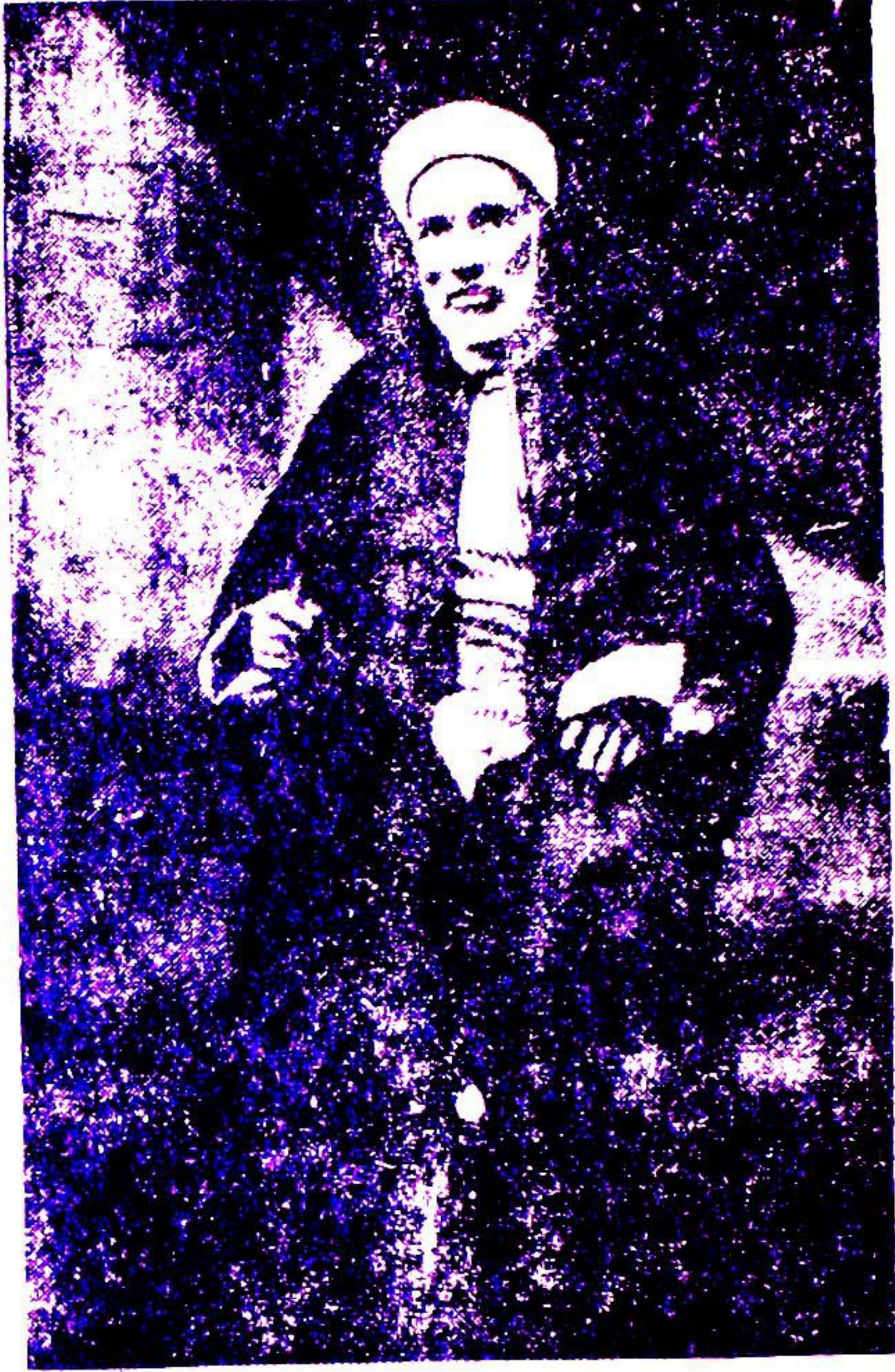
صورة المرحوم الشيخ أحمد المملوي

ولد سنة ١٣٧٣ هـ = ١٨٥٦ م وتوفي سنة ١٣٥١ هـ = ١٩٣٢ م