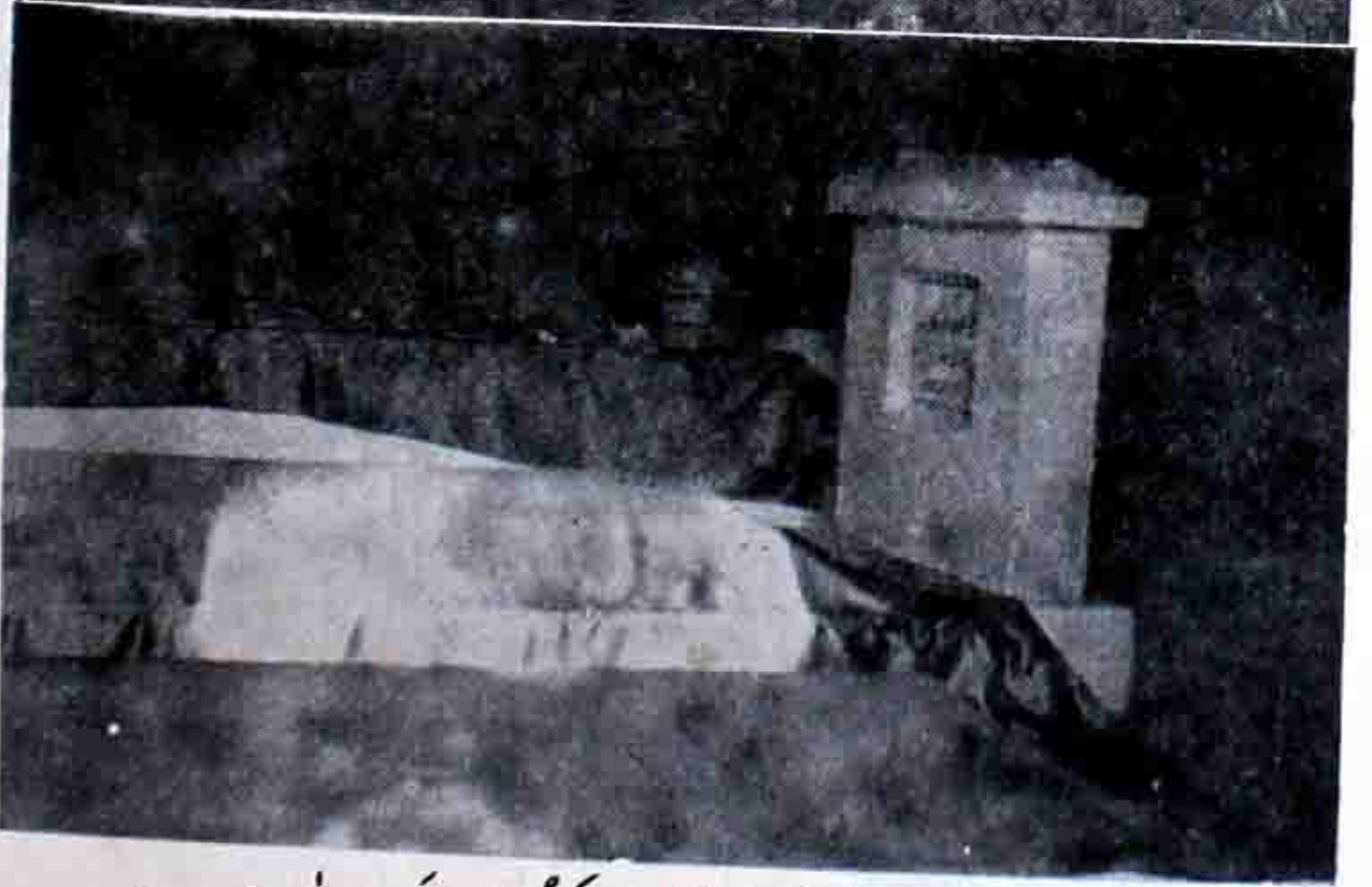
مزار مبارک حضرت خواجہ محمد معصوم رحمۃ اللہ علیہ - سرسید