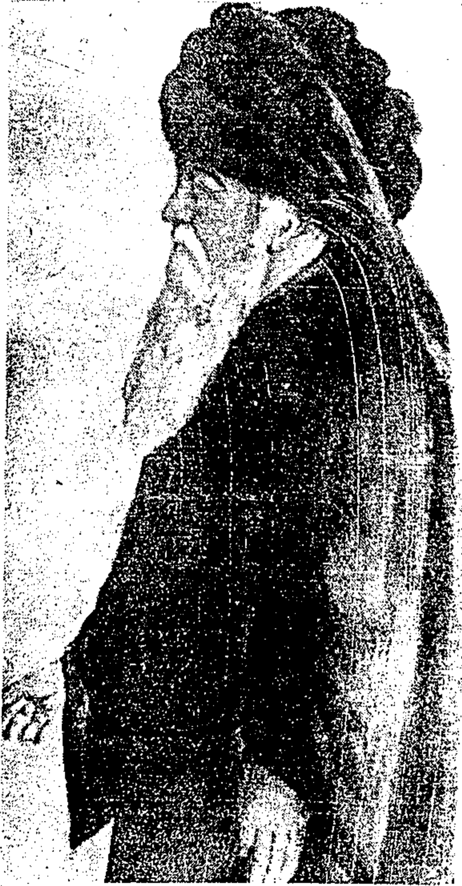
صورة رمزية للفيلسوف الكبير ابن عربي