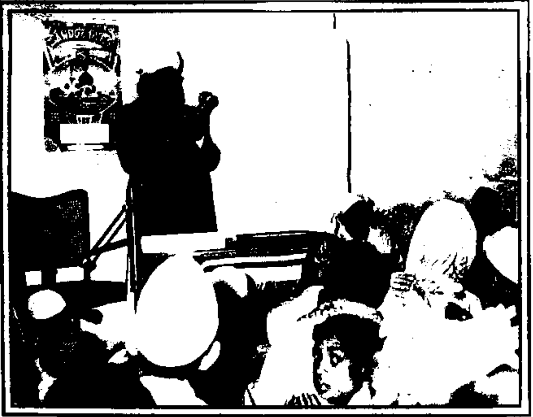
ظل سجانی حضرت آقا پیر ایرانی صبغتہ اللہ شاہ صاحب نقشبندی مدظلہ، دارالعلوم وجلسہ تقسیم اسناد کے اختتام پر دعا فرما رہے ہیں مورخہ ۱۹۶۲-۳-۵