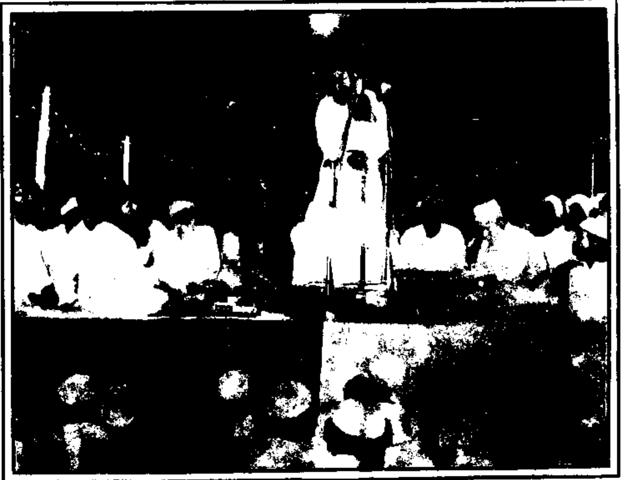
۱۹۷۹ء میں قائد اہلسنت علامہ شاہ احمد نورانی جلسہ مدرسہ رکن الاسلام جامعہ مجددیہ میں خطاب فرما رہے ہیں بانی رکن الاسلام حضرت علامہ مفتی محمد محمود، امام القراء حضرت قاری محمد طفیل نقشبندی اور دیگر علماء کرام موجود ہیں