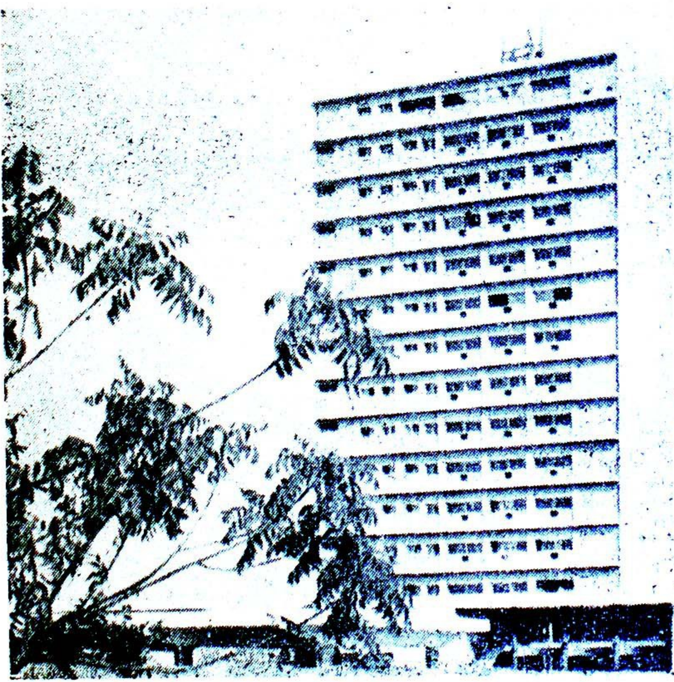
وزارة الاعلام بجدة

وانه لما يثلج القلب ويملأ النفس بهجة وسعادة ان تصل هذه البلاد الناشئة في ظرف سنوات قلائل من التطور ما لم يصل إليه غيرها في سنين عديدة ومن أبرز مظاهر هذا التطور الاذاعة التي تنقل للعالم من اجواء