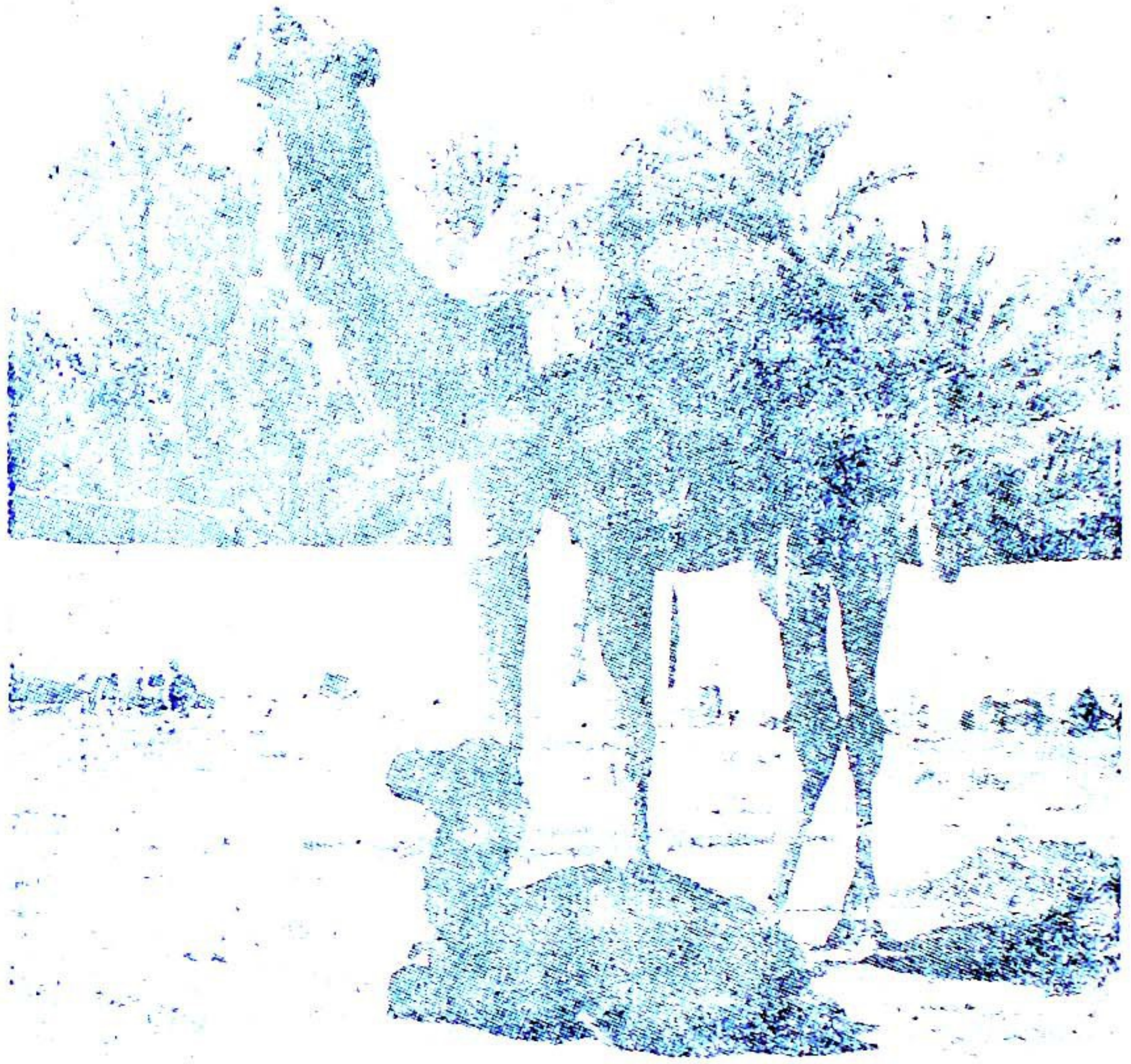
الجمال سفينة الصحراء

ولم يبق على قيد الحياة من انواع الجمال في القارتين الافريقية والاسيوية سوى نوعين هما الجمال العربي ذو السنام الواحد والمعروف في شبه جزيرة العرب وبلدان الشرق الاوسط وشمال افريقيا المسمى ( الدروميدياري ) اما النوع الآخر فهو يقطن بلدان آسيا الوسطى وهو ذو سنامين وجسمه