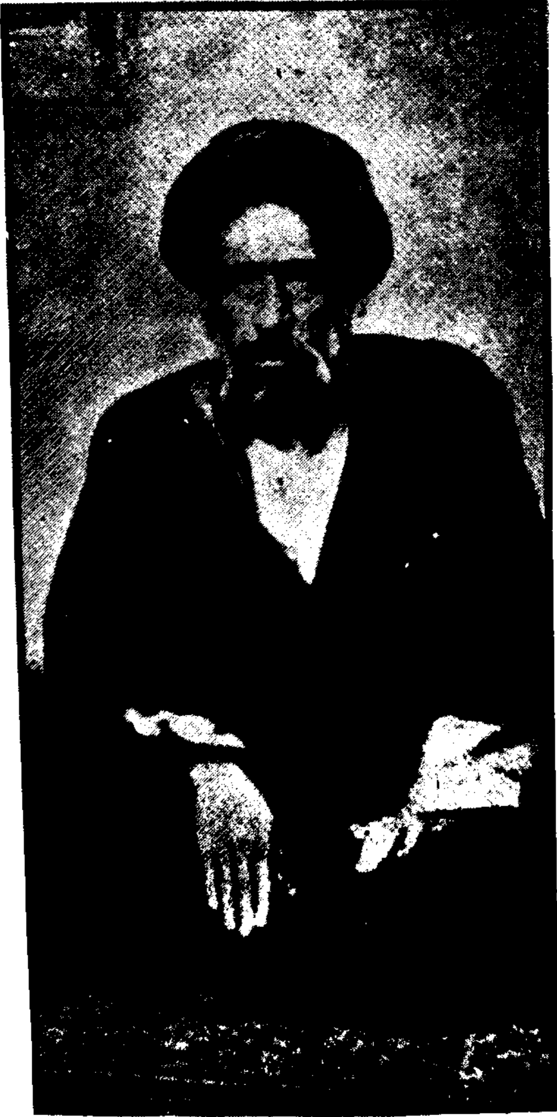
سید حسن مدرس