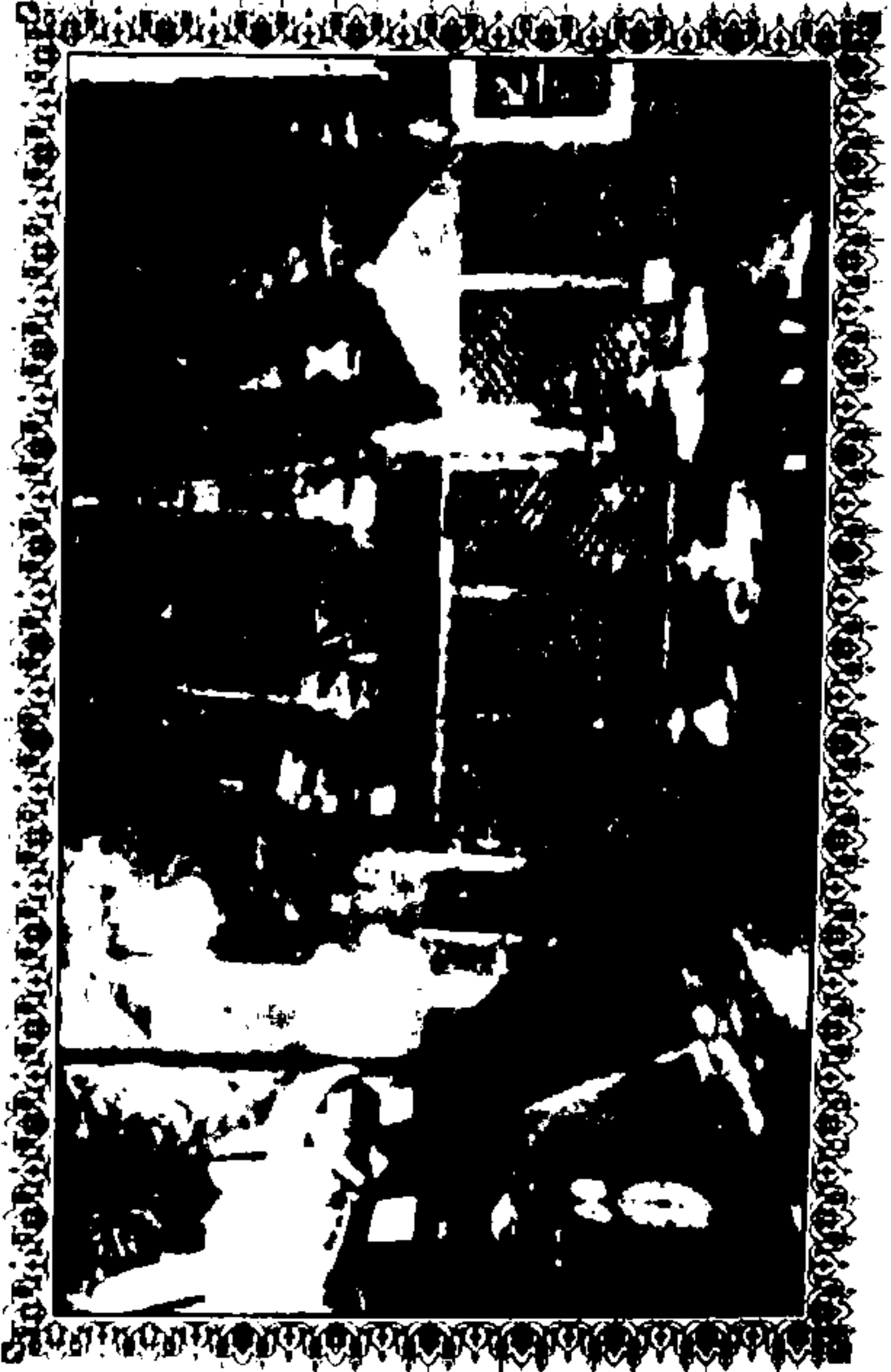
آرام گاہ، کراچی، پاکستان