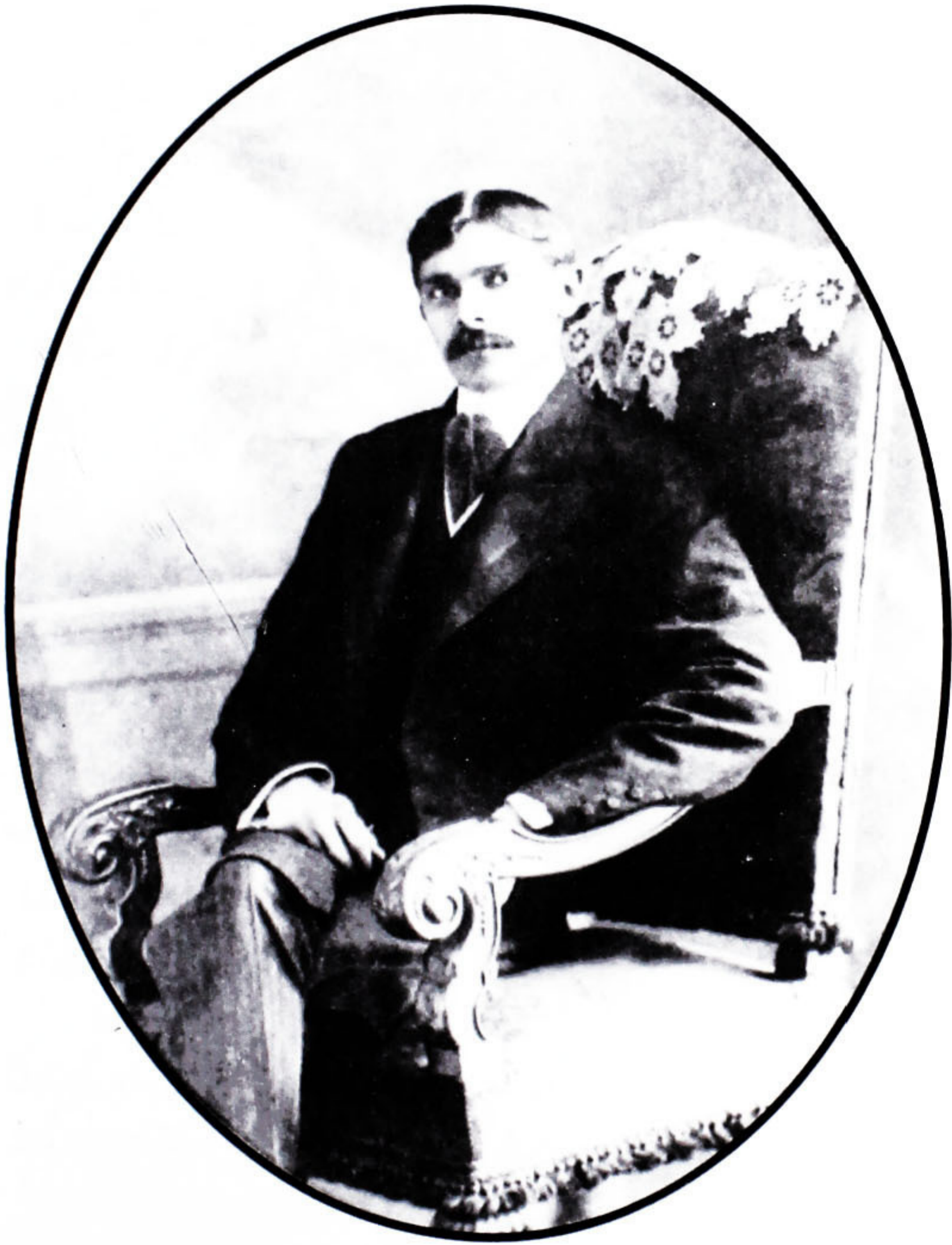
قائد اعظم کامیاب اور مشہور وکیل کی حیثیت میں