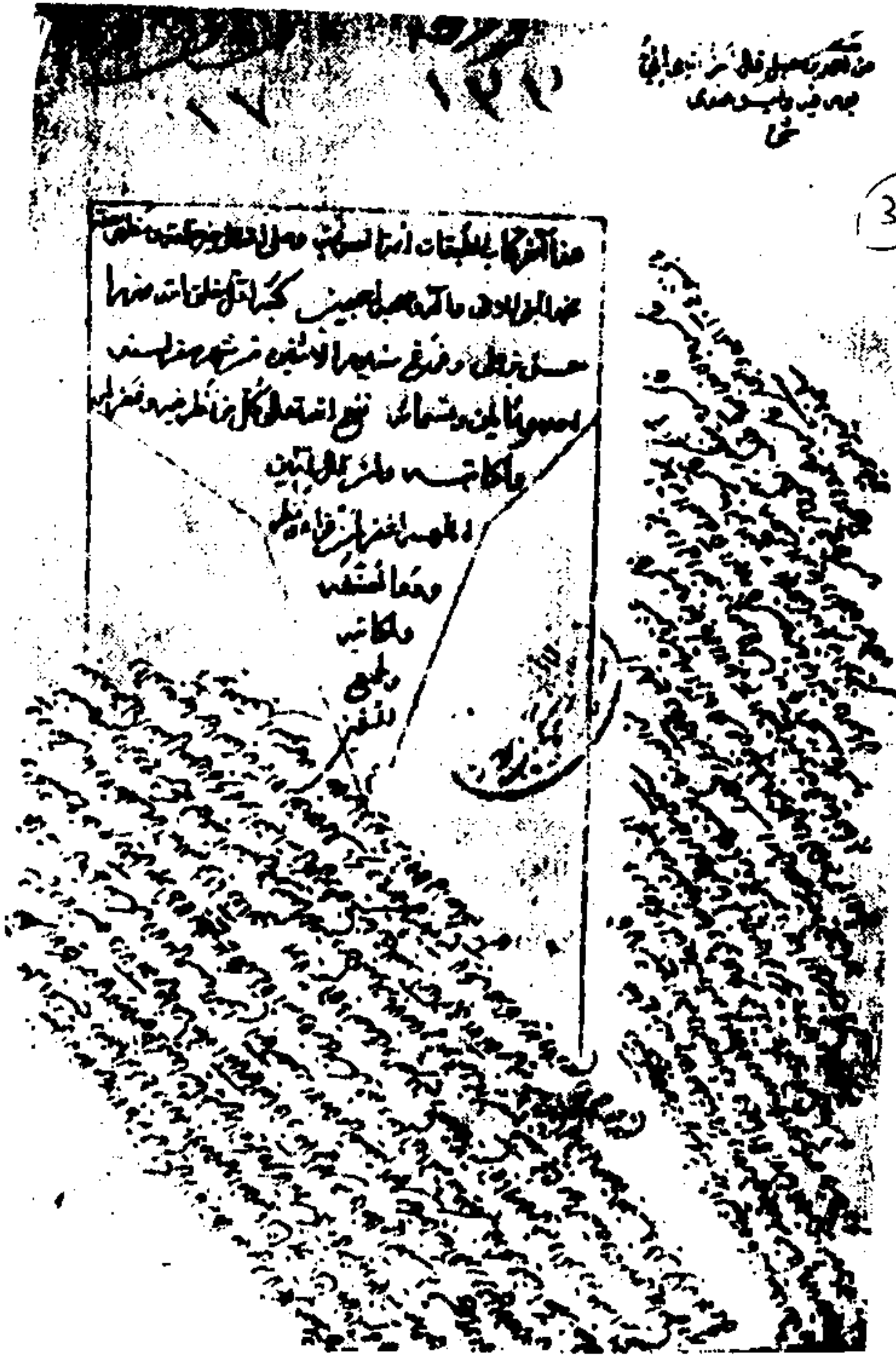
صورة آخر المخطوط