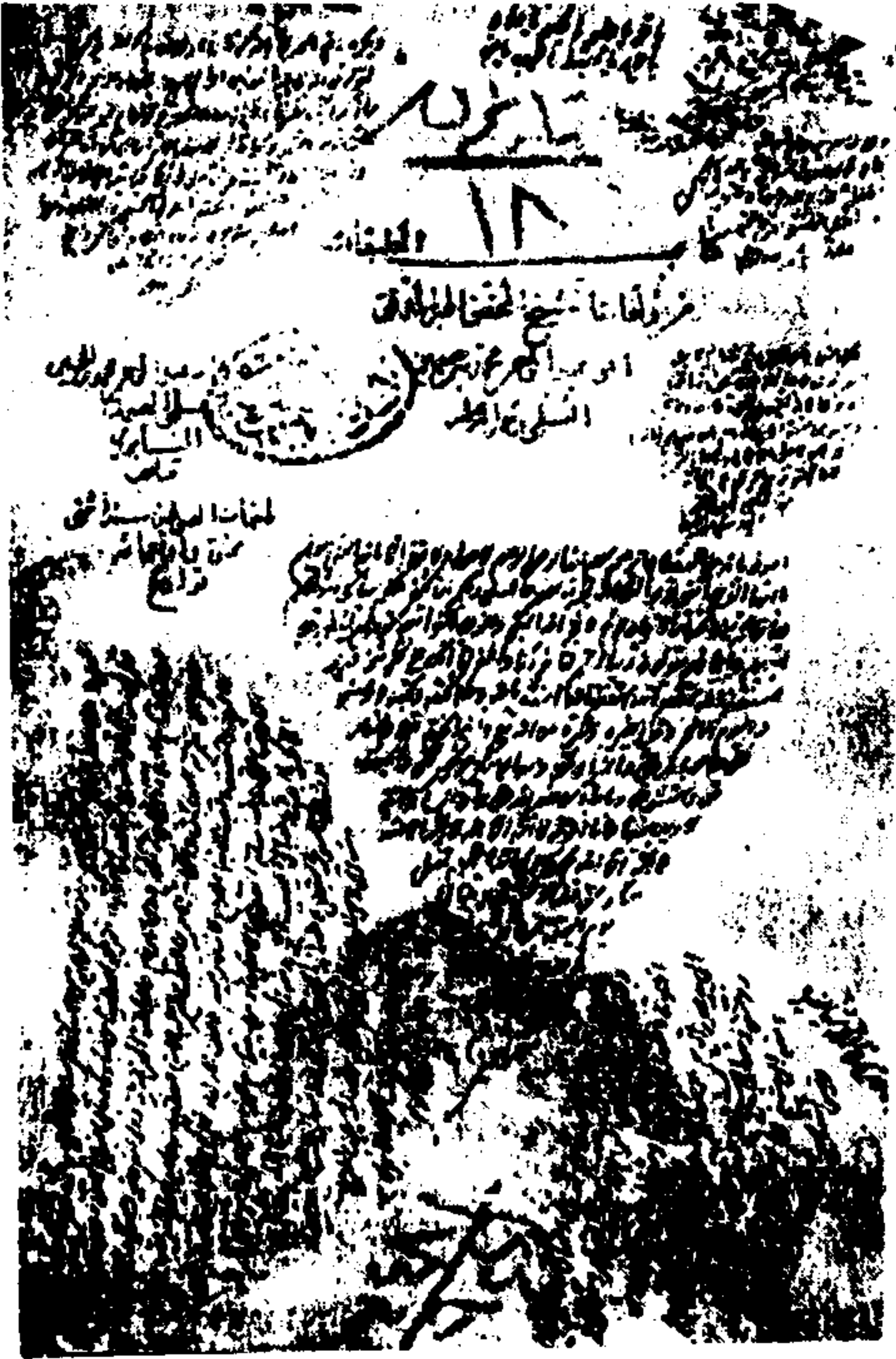
صورة غلاف المخطوط